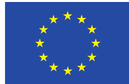
Euroopa Liit Euroopa Sotsiaalfond